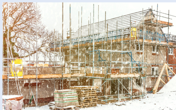
寒冷地での屋外作業