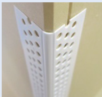
建材 樹脂成型品固定