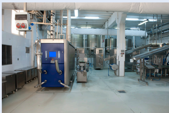
工場 冷蔵庫内の作業