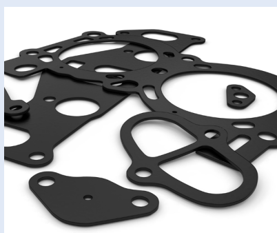
緩衝材、パッキン材固定